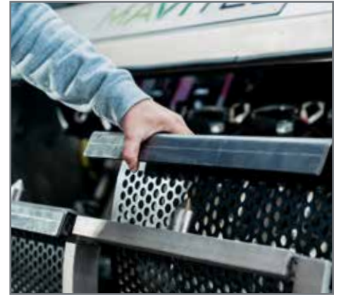
Kolay elek değişimi