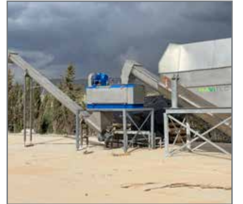
Komple Model S hattı