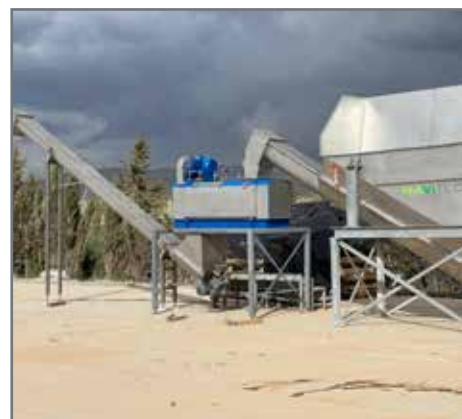
Ligne complète du Paddle Depacker Modèle S